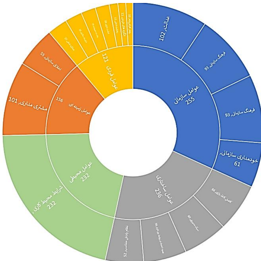
شکل ۱- مدل ارزشیابی اخلاق سازمانی